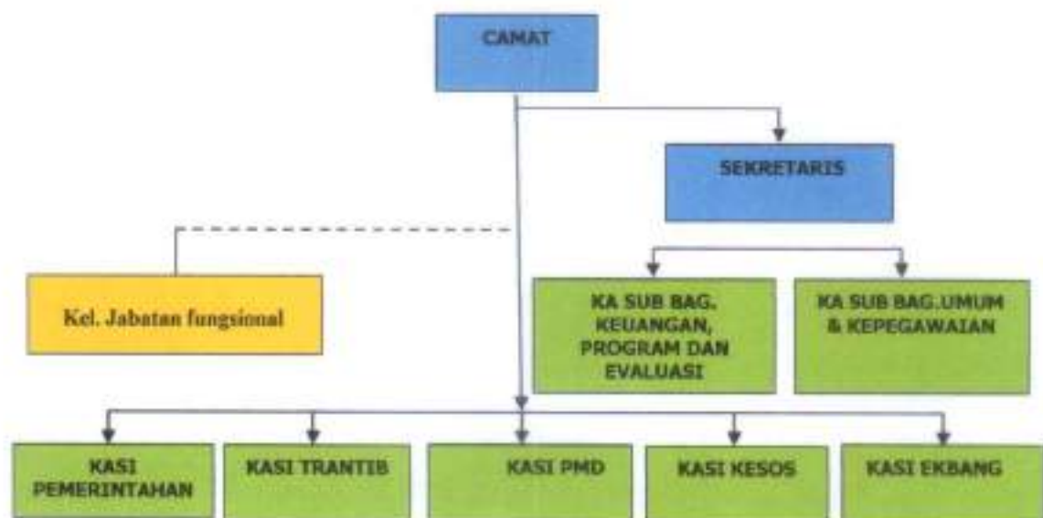
Gambar 1.1 STRUKTUR ORGANISASI KECAMATAN CARENANG (PERATURAN BUPATI SERANG NOMOR 03 TAHUN 2009)

Dibawah ini disajikan bagan struktur organisasi Kecamatan Carenang, Kabupaten Serang sebagai berikut :