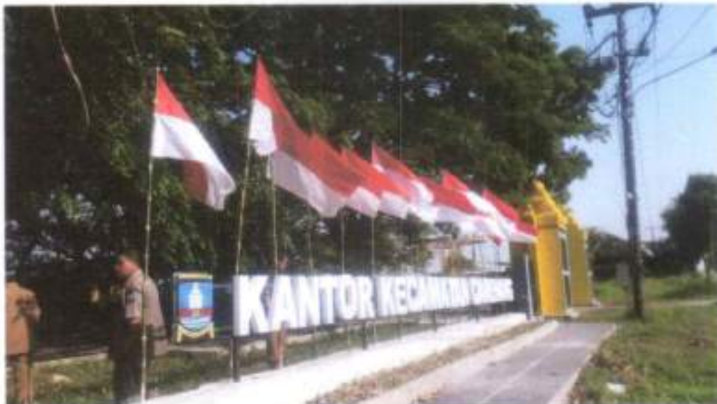
Gambar 3.2. Kantor Kecamatan Carenang