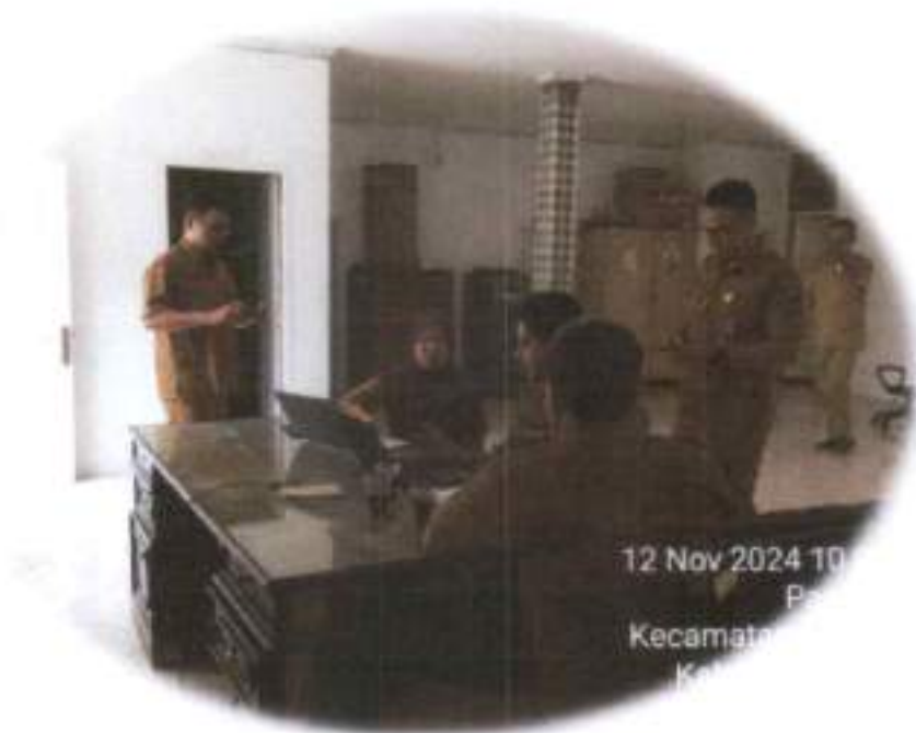
Gambar 3.3. Ruang Pelayanan