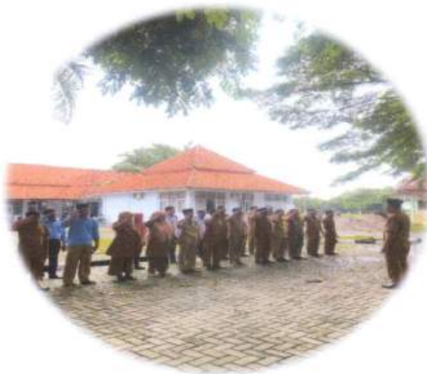
Gambar 3.4. Taman Kantor Kecamatan Carenang