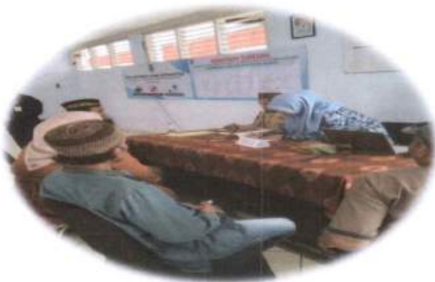
Gambar 3.6. Penjelasan Prosedur Pelayanan