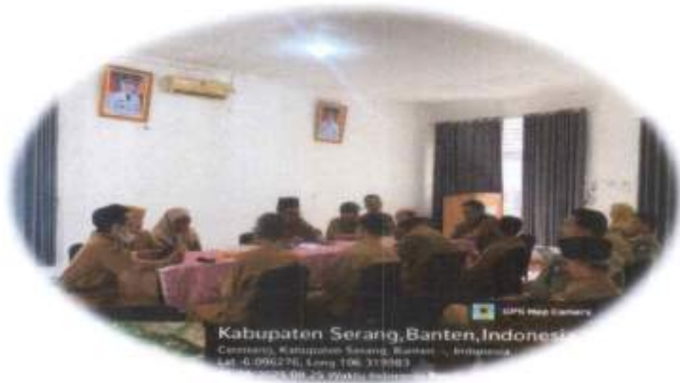
Gambar 3.5. Pembinaan SDM Aparatur